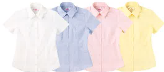
No.BS350 オフホワイト BS351 サックス BS352 ピンク BS353 イエロー スリムシャツ 半袖・角襟/S・M・L・LL ポリエステル65% 綿35% ¥3,200(税別) 形態安定加工