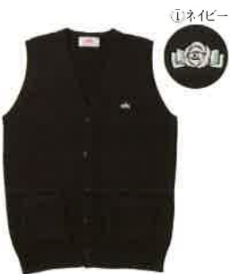
No.BK962 前開きベスト/S・M・L・LL・XL 綿100% ¥5,500(税別)