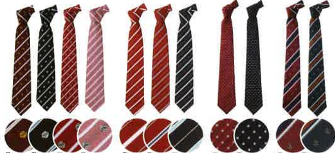
① No.BN440 ¥1,900(税別) ② No.BN441 ¥2,000(税別) ③ No.BN442 ¥1,900(税別) ④ No.BN443 ¥2,000(税別)