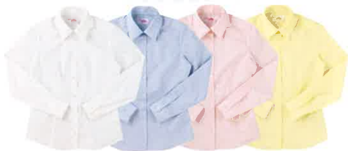
No.BS300 オフホワイト BS301 サックス BS302 ピンク BS303 イエロー スリムシャツ 長袖・角襟/S・M・L・LL ポリエステル65% 綿35% ¥3,300(税別) 形態安定加工