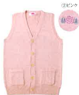
size S M L LL 身幅 45 48 51 54 着丈 62 65 68 71 (cm)