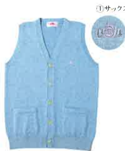
No.BK980 前開きベスト/S・M・L・LL 綿100% ¥5,500(税別)