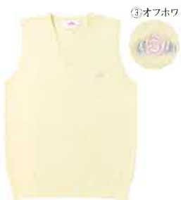
No.BK960 Vベスト/S・M・L・LL 綿100% ¥4,700(税別)